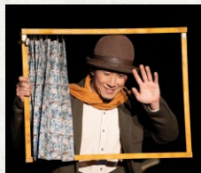
サクノキ 【クラウン】